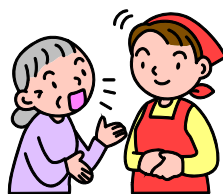
困りごとを気軽に相談できる