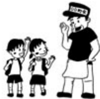
子どもやお年寄りの方への声かけ