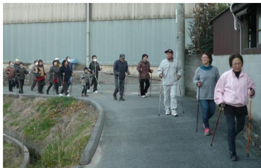
ウォーキングを通じた地域交流の場づくり （波方町大浦地区）