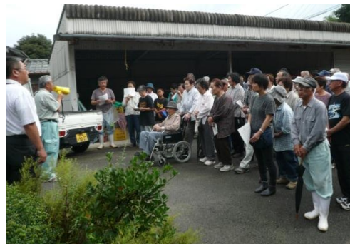
地域ぐるみでの避難訓練 （波方町森上地区）