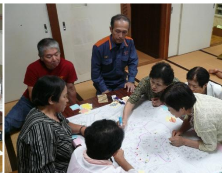
樋口平石地区（9月6日）