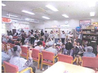
デイサービス訪問・交流