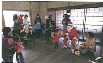
サロン訪問・交流 (Xmas会)