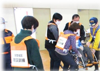
地域の防災訓練への協力

今治市内のボランティア・市民活動や福祉教育の一層の充実をはかり、支え合う地域づくりのための環境整備や災害ボランティアの養成・体制づくり、地域住民の福祉意識を高める活動に取り組んでいます。