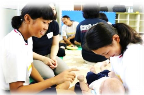
小中高等学校等での福祉教育