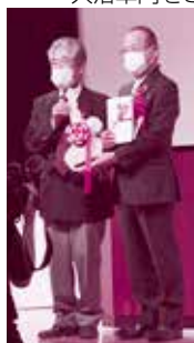
菊川会長(左)と長野会長(右)

今治ライオンズクラブ様より結成60周年記念として入浴車両をご寄付いただきました。