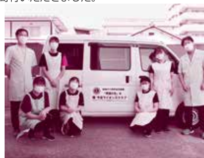
「希望の光」号と訪問入浴スタッフ