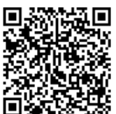
ボランティア保険