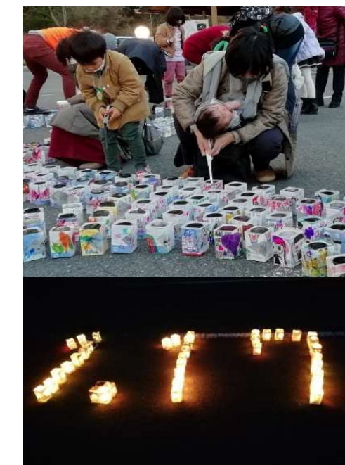
「きずな」「1.17」の形に並べられた紙灯籠に火が灯され、黙とうをささげました