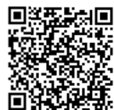
ボランティア登録

例) 団体の登録については、3名以上で構成され、その過半数が市内在住または在勤、在学 (※詳細は、今治市社会福祉協議会ホームページに掲載)