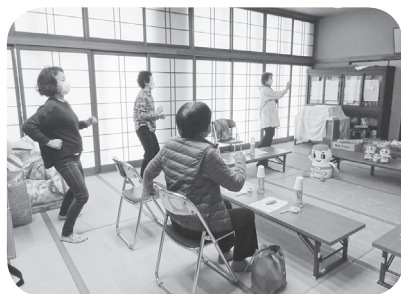
『便強塾』で、排泄トラブルを回避できるように勉強しました

在宅介護者のつどいは、ご自宅で介護をされている家族の方を対象に、 介護の悩みや不安を介護者同志の交流を通して負担を軽くすることを目的としています。