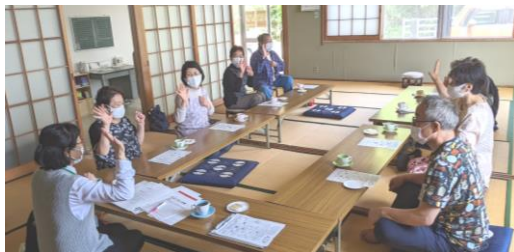
ふれあいサロン宮崎

コロナウイルス感染拡大防止のため、しばらく休止していましたが、感染対策を行いながら少しずつ再開されています。