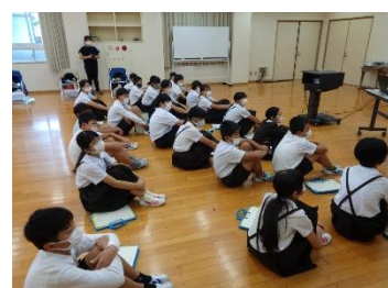
福祉への理解を深める学習