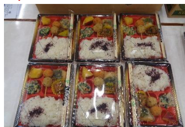
住民の見守り・支えあい活動 (ふれあい食事サービス)