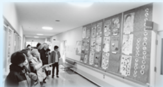
安心安全なまちづくり支援事業

地域の一斉清掃、配食やデイサービスのボランティア、小・中・高等学校児童生徒の夏休みボランティアなど安心して活動が出来るよう支援させていただきます。