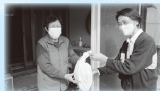
ふれあい訪問事業

小・中・高校で、ふくし（ふだんのくらしのしあわせ）について学びます。高齢者疑似体験や点字体験、グループワークなどを通して自分たちにできることを考えることで思いやりの心を育てていきます。