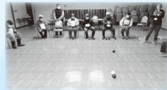
障がい者サポート交流事業

小・中学生が考えた標語の町内設置や、「ポスターコンクール」を実施しています。今年度は「みんなが幸せに暮らせる合言葉」をテーマに行い地域の様々な場所に設置させていただきました。