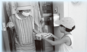
ボランティアの保険

地域の一斉清掃、配食やデイサービスのボランティア、小・中・高等学校児童生徒の夏休みボランティアなど安心して活動が出来るよう支援させていただきます。