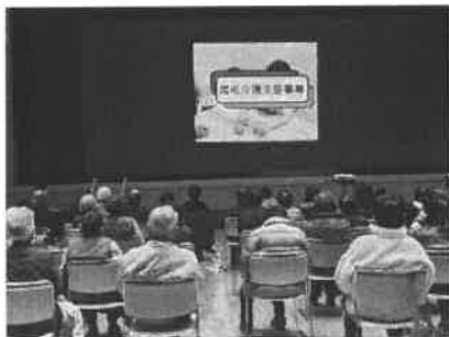
今治社協の取り組み紹介