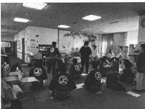
つながりを絶やさない取り組み (高齢者オンライン友愛訪問)

今治市社会福祉協議会吉海支部の地域福祉事業は、皆様からの会費、寄付金、共同募金の配分金などで実施しています。