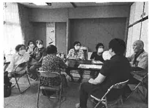
お互いに相談し合える関係づくりと 集いの場の提供