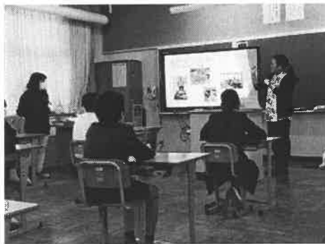
吉海の未来を支える取り組み (郷土愛を育む福祉体験学習)